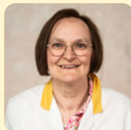
Bea gaat na een lange carrière met pensioen